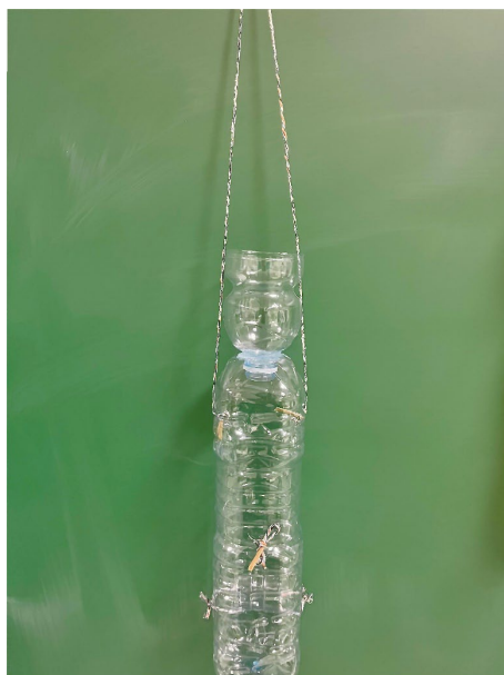
Figura 1: esempi di trappole di coleottero giapponese costruite da allievi/e del liceo.

A) Bottiglia di PET in cui è stata tagliata la parte sopra e capovolta utilizzandola come imbuto. B) Bottiglia del latte incollata ad un contenitore di una crema. C) Bottiglia di pet incollata con un altro pezzo (superiore) di bottiglia.