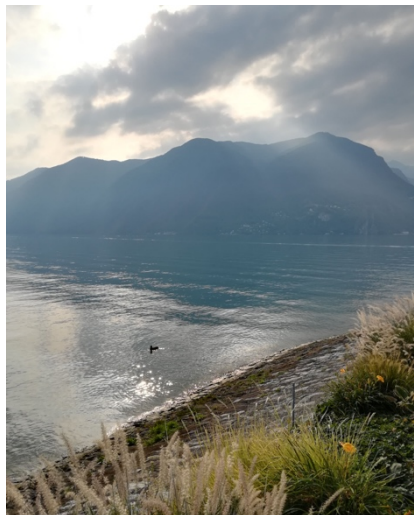
Figura 3: Lago di Lugano