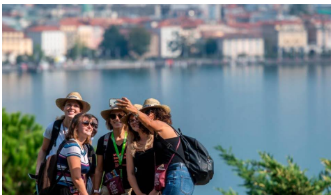
Figura 2: Lugano passeggiata