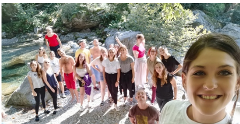
Figura 4: La mia classe durante la settimana del territorio