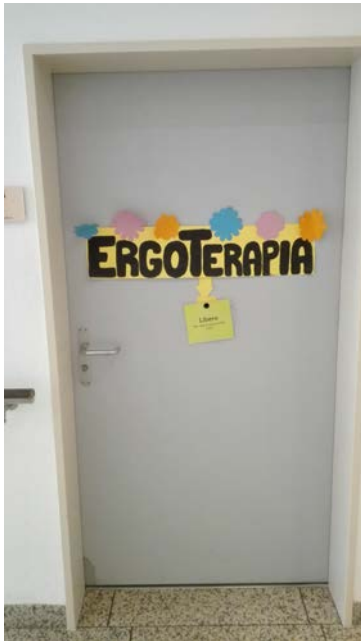
Porta dell'ergoterapia a Rivabella

Fortunatamente ho avuto alcuni giorni, prima di iniziare lo stage, per conoscere meglio la città, i posti belli, i trasporti pubblici e anche il mio nuovo alloggio. I miei genitori mi hanno portata a Lugano con tutte le mie valige e la mia bici (quanto ero contenta di avere una bici a Lugano!) e quindi avevo anche il tempo per passare alcuni giorni belli con loro.