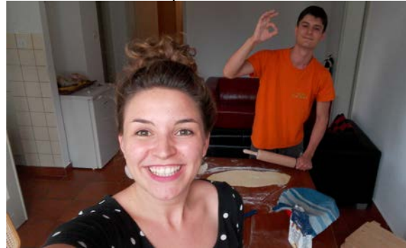
Fare le tagliatelle a casa nostra: DONE

Alcune care amiche sono venute a trovarmi, per poter vedere che bella vita sto passando a Lugano. Qui ci si sente veramente come in vacanza! Abbiamo cucinato tante cose buone (è vero che il cibo nei ristoranti è abbastanza caro) e abbiamo scoperto dei posti incredibili al lago (vi posso solo consigliare il Lido San Domenico!)