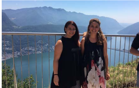
San Salvatore con la mia responsabile di stage