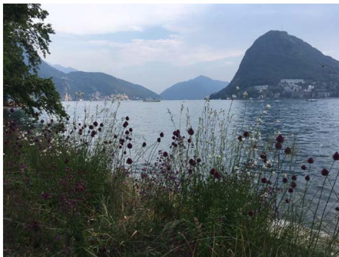
Il lago di Lugano, visto dal parco Ciani

Durante la procedura organizzativa ho deciso di fare il mio secondo stage nell'ambito della geriatria e gerontopsichiatria. I coordinatori della SUPSI hanno trovato un bellissimo posto dove poterlo fare: la Residenza Rivabella. Poi, anche col'aiuto dei dipendenti dell'International Office, ho trovato un alloggio a Lugano, che ho condiviso con due carissimi ragazzi, con i quali ho instaurato un bellissimo rapporto di amicizia.