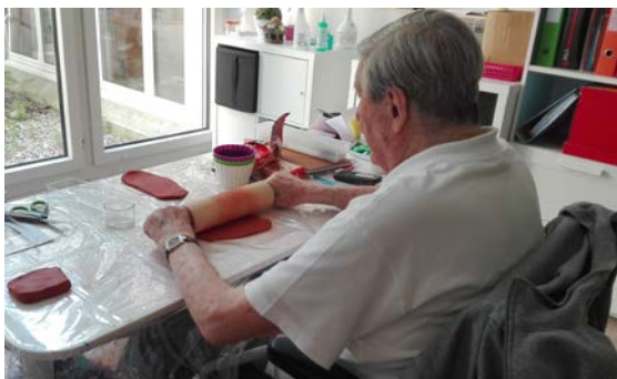
Un cliente sta facendo un lavoro con argilla

Ci siamo capite, come già accennato, molto bene a livello emozionale, ma anche a livello professionale. Lei mi ha dato la possibilità di imparare tanto: Da metodi concreti come la "validation" o l'approccio ludico fino a tantissime competenze nella comunicazione con gente anziana.