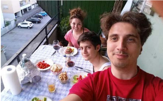
Serata tra coinquilini: tartar e vino rosso

Oltre alle mie buone esperienze al lavoro ho anche fatto alcune amicizie fuori dal lavoro e mi sono goduta un po' il "dolce far niente" durante i weekend liberi. Con i miei coinquilini ho passato due mesi meravigliosi: tra cucinare insieme, fare il bagno nel lago, andare a Milano, Locarno o Bellinzona, fare grigliate al lago e tant'altro. Ho conosciuto i loro amici e abbiamo passato tantissime belle ore anche solo facendo chiacchierate filosofiche sul nostro piccolo balcone. Penso che sia più facile esprimere quanto mi ha fatto bene stare con loro tramite le seguenti foto che con tante parole: