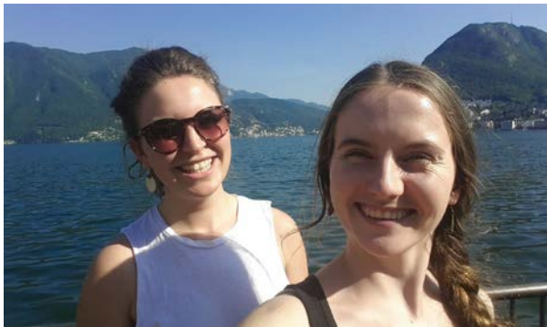
Serata splendida con una cara mia amica

In generale posso sottolineare che questa esperienza nel Ticino è stata una possibilità bellissima di conoscere un altro modo di vivere, nuova gente e nuovi amici, e per conoscere meglio me stessa. Nella mia mente resteranno i cari ospiti di Rivabella che con il loro sorriso e la loro saggezza mi hanno rubato un pezzo del mio cuore. Ci resteranno anche i miei colleghi che mi hanno fatto ridere con ogni piccola battuta. Ma soprattutto non mi dimenticherò mai dei miei carissimi coinquilini e la mia responsabile di stage che è anche diventata un po' come un'amica. Erano tutti loro che mi hanno aiutato a sentirmi bene ogni singolo giorno di questi due mesi meravigliosi.