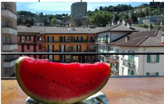
Vista dal balcone di casa mia

Parlando della vita a Lugano devo ammettere che ero molto contenta di aver trovato alloggio a Molino Nuovo. Ho vissuto quasi in centro della città, avevo tutti i negozi e gli uffici intorno e con la bici mi servivano cinque minuti per andare al lago. La sera potevo uscire tranquillamente e anche tornare a casa a piedi. Inoltre i miei vicini di casa erano tutti simpaticissimi. È vero che sono rimasta stupita dalla gentilezza e la cordialità dei ticinesi. Erano sempre disposti di aiutarmi in qualsiasi situazione: nei negozi e anche negli uffici amministrativi e addirittura i conduttori degli autobus mi hanno salutato ogni singola mattina quando io ero ancora mezza addormentata. Secondo me anche questo fa parte dell'alta qualità di vita che è presente a Lugano.