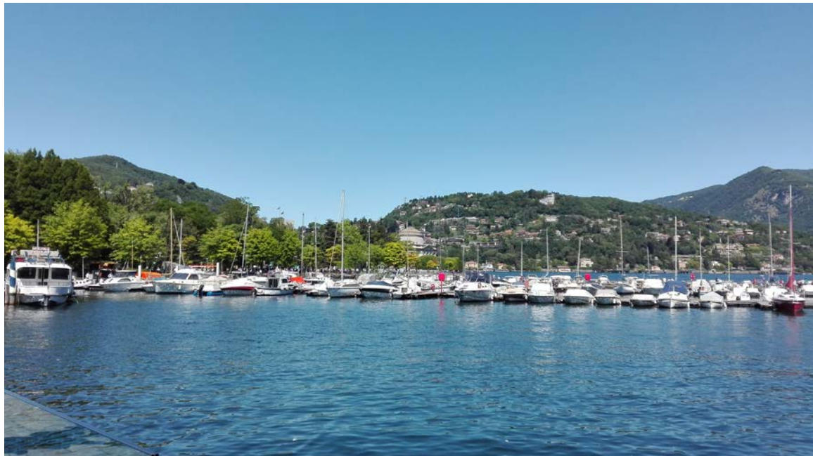
Meraviglioso lago di Como: I laghi mi hanno rubato il cuore