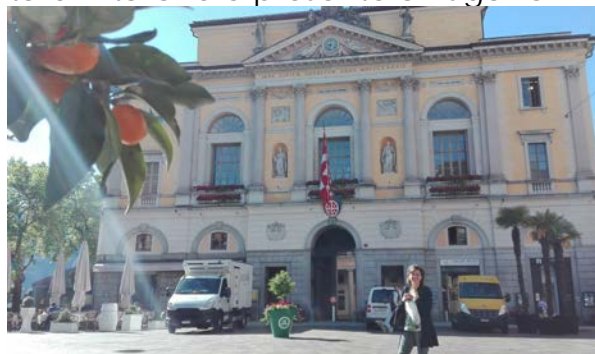
Municipio di Lugano, visto dal bellissimo caffè Vanini