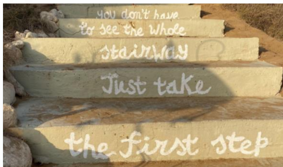
Scale spiaggia Singita Bay

Ho scelto Malta perché ero consapevole che avrei avuto la possibilità di immergermi in un ambiente estremamente multiculturale. Credo che nel mio caso questo sia stato l'aspetto che ha caratterizzato di più tutta la mia mobilità; ho avuto l'occasione di lavorare, di conoscere e di confrontarmi con persone provenienti da ogni parte del mondo.