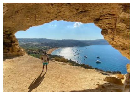
Tal Mixa Cave, Gozo