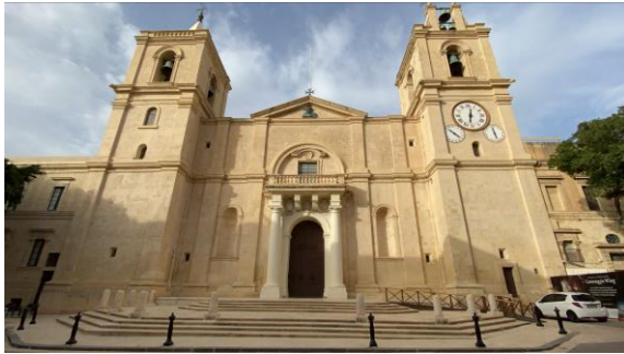
St. John's Co Cathedral, Valletta