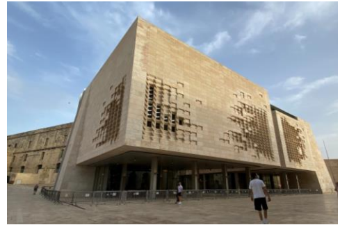
Parlamento di Malta , Valletta