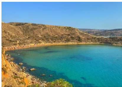
Singita Miracle Beach, Ghajn Tuffieha Bay