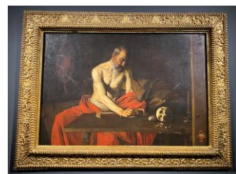
Interno St. John's Co Cathedral, Opera d'arte di Caravaggio