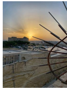
Central Bank of Malta, Valletta