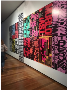
Esposizione, Biennale di Porto.