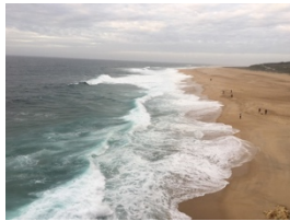
Tappa a Nazaré, Portogallo.