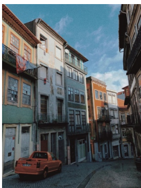
Vicoli caratteristici di Porto.