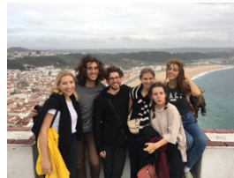
Amici a Nazaré, Portogallo.