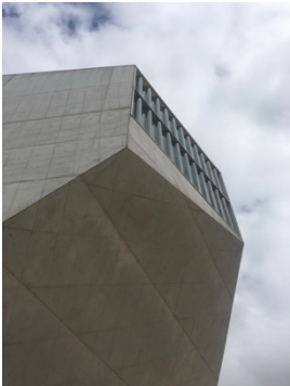
Casa da Musica, Porto.