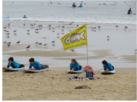
Corso di Surf, organizzato durante la Welcome week.