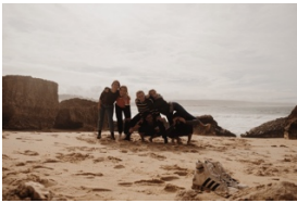
Viaggio verso Lisbona.