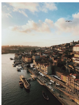
Vista dal ponte Saint Luis, Porto