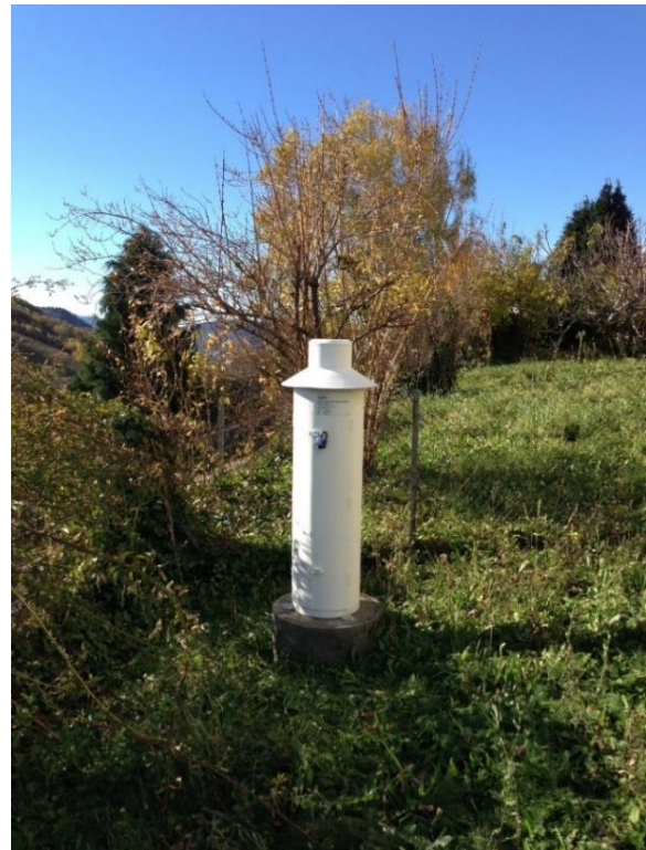
Immagine della strumentazione precedente il rinnovo.