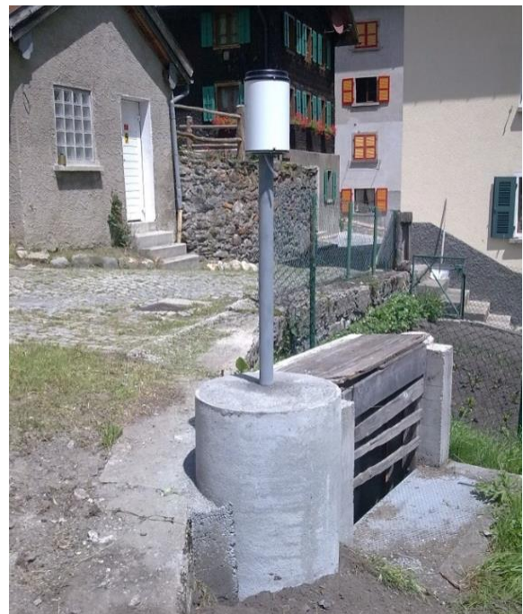
Immagine della strumentazione precedente il rinnovo.