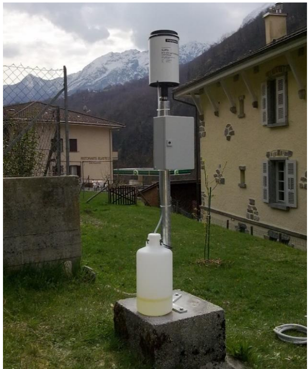
Immagine della strumentazione precedente il rinnovo.