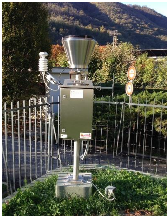
Immagine della strumentazione precedente il rinnovo.