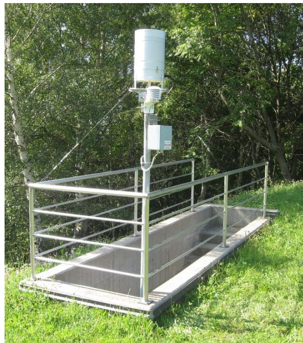
Immagine della strumentazione precedente il rinnovo.