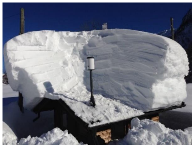
Immagine della strumentazione precedente il rinnovo.