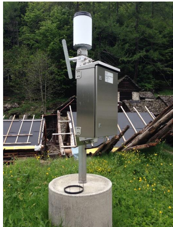
Immagine della strumentazione precedente il rinnovo.