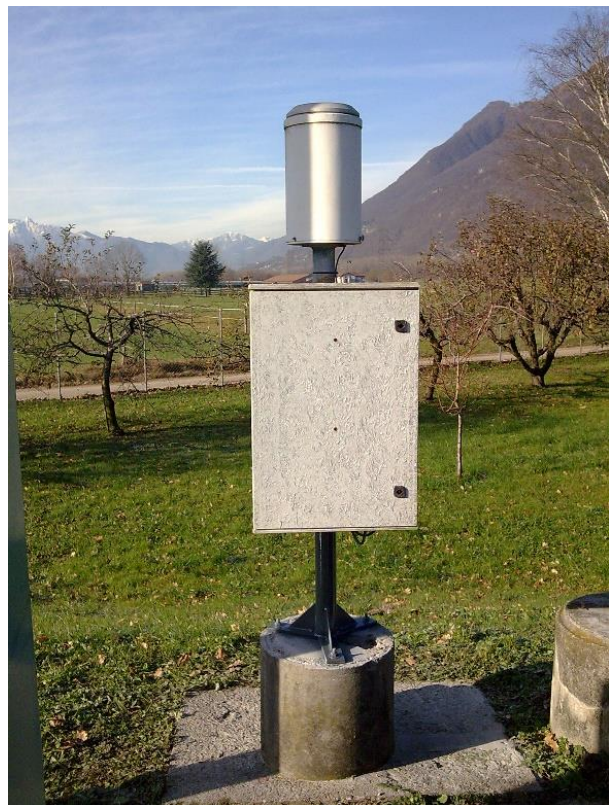
Immagine della strumentazione precedente il rinnovo.