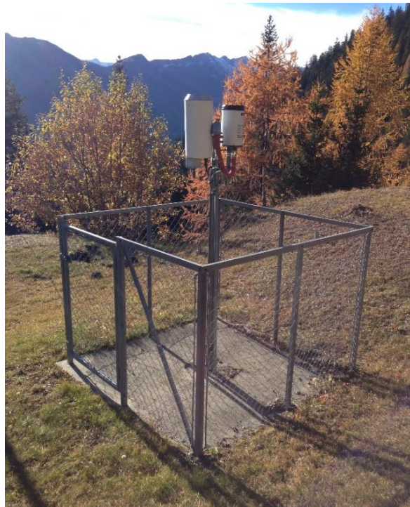
Immagine della strumentazione precedente il rinnovo.