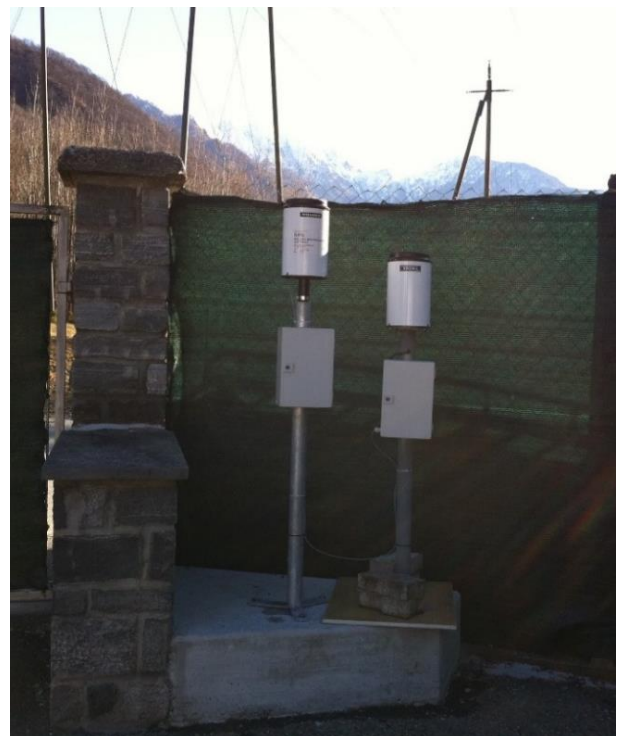
Immagine della strumentazione precedente il rinnovo.