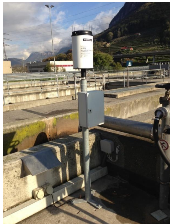
Immagine della strumentazione precedente la sostituzione.