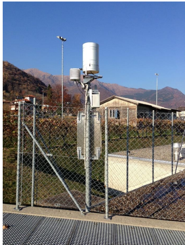
Immagine della strumentazione precedente il rinnovo.