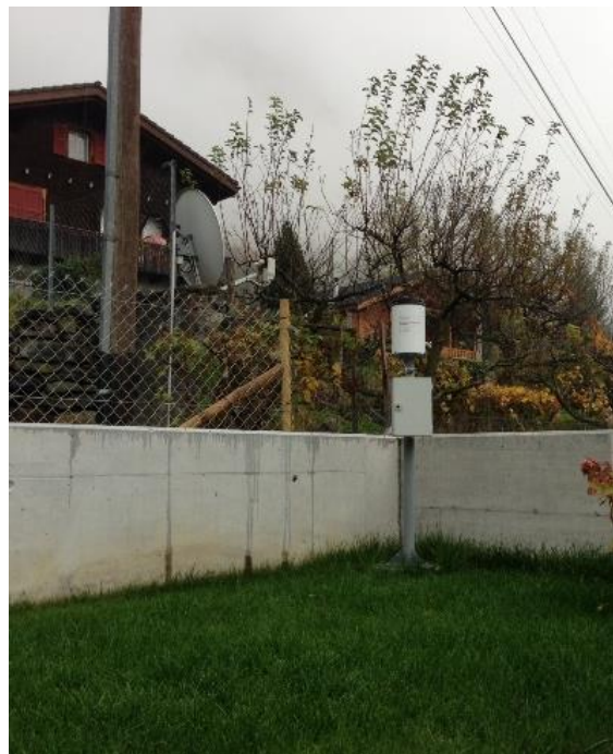
Immagine della strumentazione precedente il rinnovo.